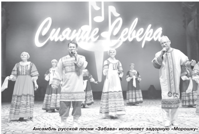
Ансамбль русской песни «Забава» исполняет зазорную «Морошку»

С очередной победой вернулись творческие коллективы Культурно-спортивного центра ООО «Газпром трансгаз Чайковский» с финала корпоративного фестиваля-конкурса «Факел» ОАО «Газпром», который в этот раз прошел в олимпийском Сочи, на Красной Поляне.