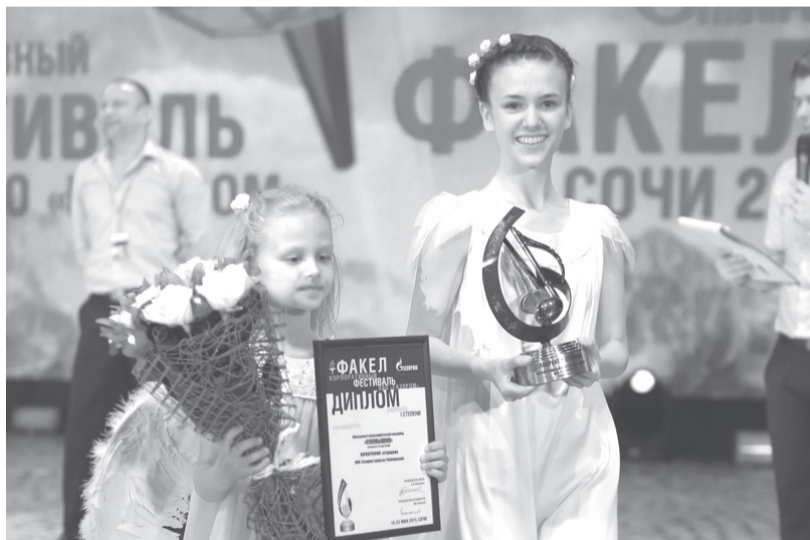
Дипломом лауреата 1-й степени награжден Образцовый хореографический ансамбль «Солнышко».